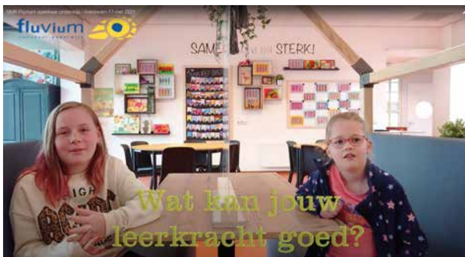
Still van GMR Fluvium online.