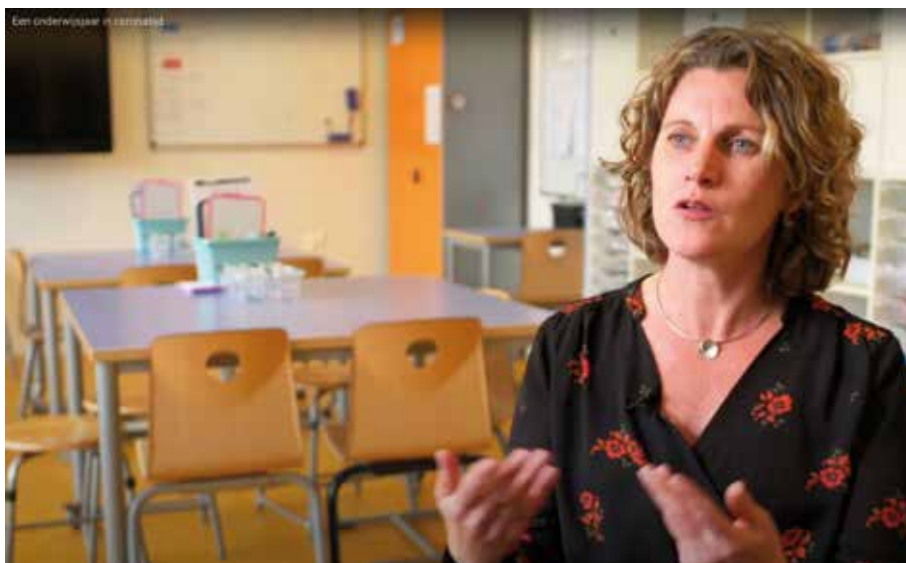
Still van minidocumentaire 'Een onderwijsjaar in coronatijd'.

Wat ons betreft van harte aanbevolen om eens rustig voor te gaan zitten. (lengte: 17 minuten)